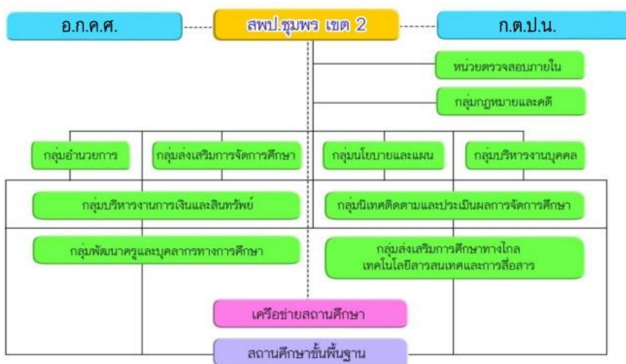
ภาพที่ ๑ แสดงโครงสร้างการแบ่งส่วนราชการของสำนักงานเขตพื้นที่การศึกษาประถมศึกษาชุมพร เขต ๒

ปีงบประมาณ พ.ศ.๒๕๖๕ สำนักงานเขตพื้นที่การศึกษาประถมศึกษาชุมพร เขต ๒ มีหน่วยงานในการกำกับจำแนกเป็น ๑) หน่วยงานในสำนักงานเขตพื้นที่ จำนวน ๙ กลุ่ม ๑ หน่วย ๒) หน่วยงานระดับสถานศึกษา จำนวน ๑๑๙ โรงเรียน รายละเอียดดังแผนภาพที่ ๑