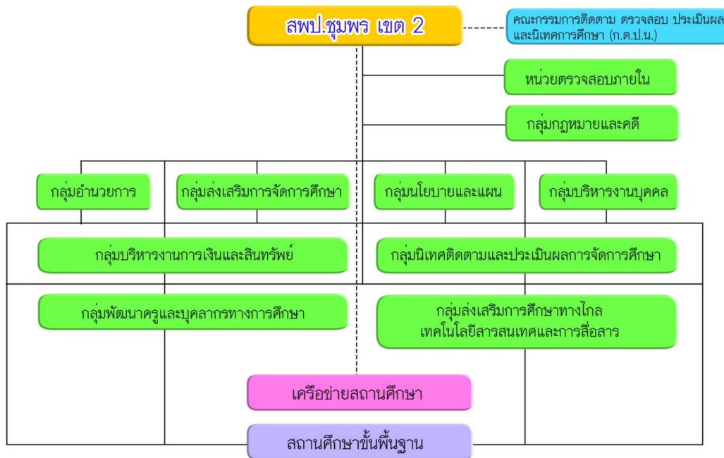
ภาพที่ ๑ แสดงโครงสร้างการแบ่งส่วนราชการของสำนักงานเขตพื้นที่การศึกษาประถมศึกษาชุมพร เขต ๒

ปีงบประมาณ พ.ศ.๒๕๖๔ สำนักงานเขตพื้นที่การศึกษาประถมศึกษาชุมพร เขต ๒ มีหน่วยงานในการกำกับจำแนกเป็น ๑) หน่วยงานในสำนักงานเขตพื้นที่ จำนวน ๙ กลุ่ม ๑ หน่วย ๒) หน่วยงานระดับสถานศึกษา จำนวน ๑๑๙ โรงเรียน รายละเอียดดังแผนภาพที่ ๑