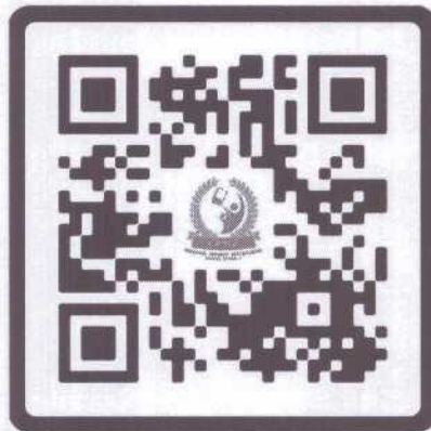
SAR 63 : Phato