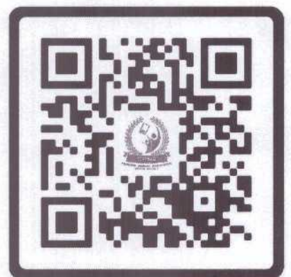
SAR 63 : Phupha - Nasak