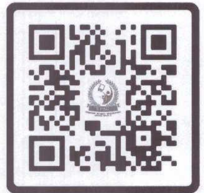
SAR 63 : Lamae