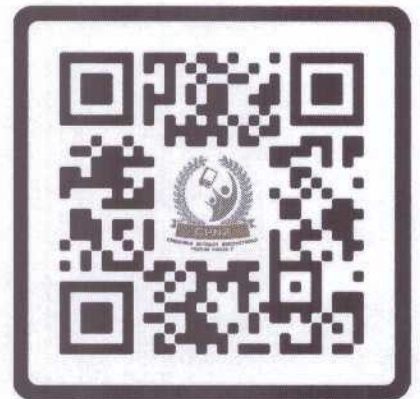
SAR 63 : Lang Suan 3